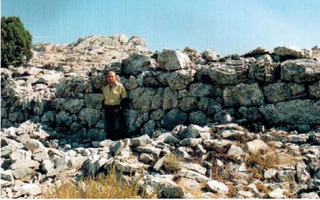
Fotoğraf 2: Işıklı Sarıbaba tepesinde bulunan tarihi ve Arkaik Döneme kadar uzanan Yukarı Şehirin Dış Surları/Kale (Eumenieia)