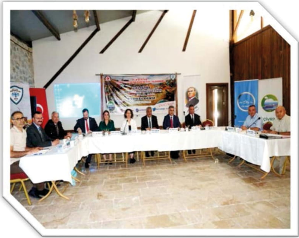
Çivril Miryokefalon alıřtayı, 16 Eylöl 2022