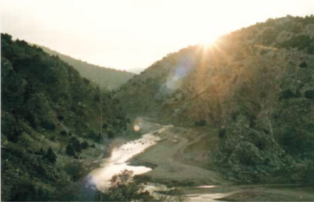
Fotoğraf 3: Tzyritze Boğazı. Boğazın Sandıklı Ovasına yani boğazın ucundaki Otrous Antik Kentine çıkış yeri. (Bizans diliyle Ciybrilcymani-Civrilcimani)