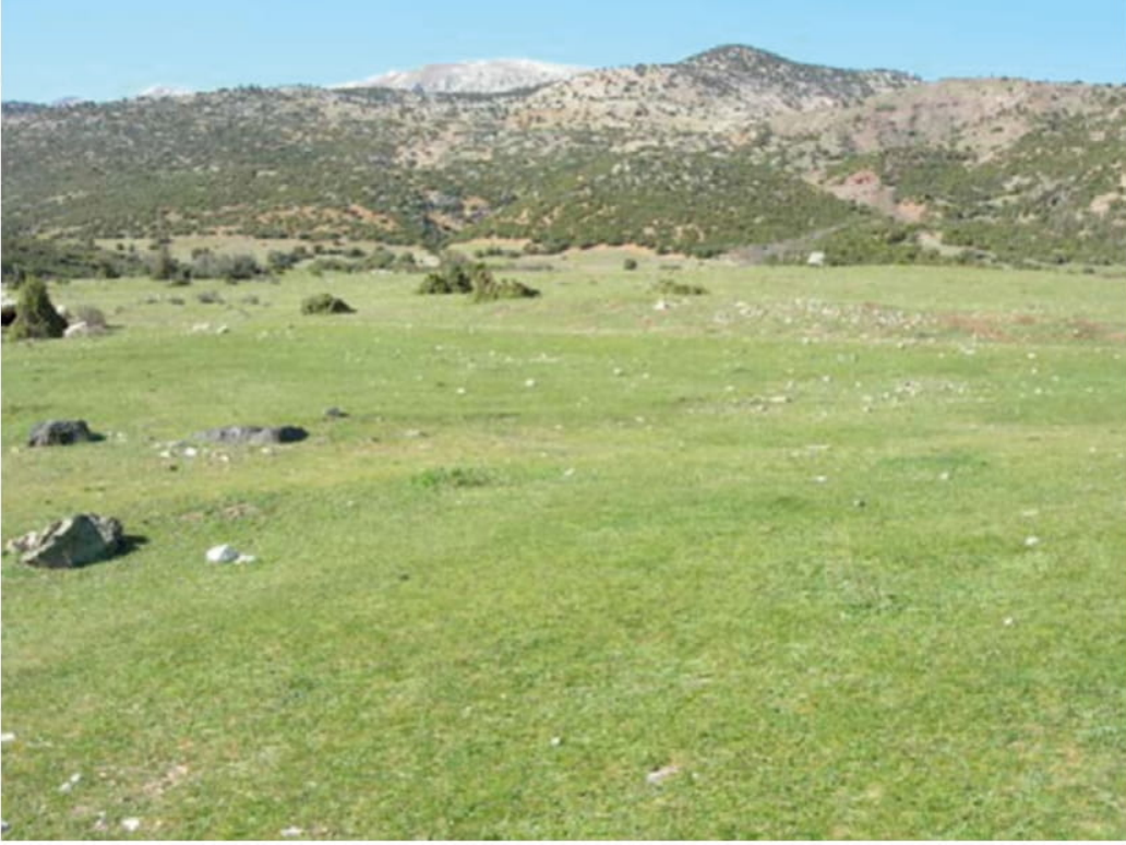
Fotoğraf 1: Savaş sonrası yıktırılan Soublaion-Siblia Kalesinin bulunduğu alan. Gümüşsu'daki su kaynağı muhtemelen bu Kalenin içindeydi ve bu nedenle çok önemli bir istihkâm kalesi idi. (Khoma-Homa-Gümüşsu)